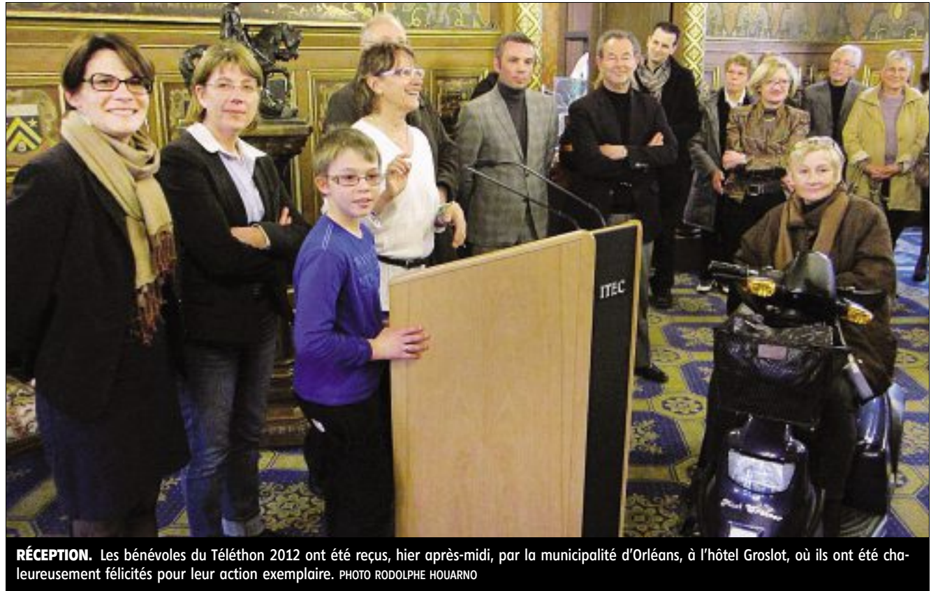
RÉCEPTION. Les bénévoles du Téléthon 2012 ont été reçus, hier après-midi, par la municipalité d'Orléans, à l'hôtel Groslot, où ils ont été chaleureusement félicités pour leur action exemplaire.